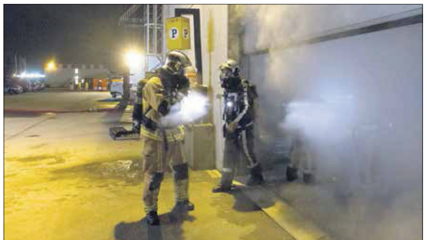
In actie bij de 'parkeergarage' op het oefenterrein.

met water naar binnen, zo snel mogelijk achter 1 en 2 aan. De stoelen 4 en 5 zijn achter de chauffeur en de bevelvoerder. Wie daar zit helpt de chauffeur met het aanleggen van de verbinding tussen de slangen van de autospuiter en de waterbron. Daarna gaat nummer 4 direct naar nummer 3. Nummer 5 zorgt eventueel voor een tweede slang en helpt met het naar binnen geleiden van de volle slang. Ook bij andere incidenten, zoals een ongeluk, bepaalt de stoel de taak.