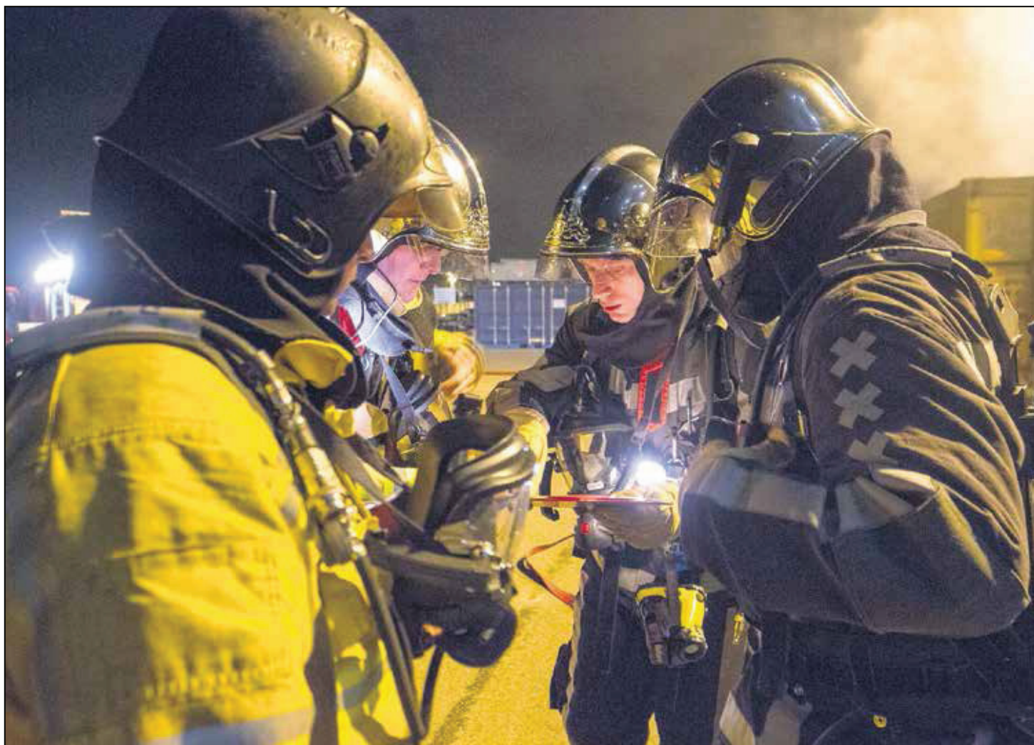
Samenwerken is van groot belang.